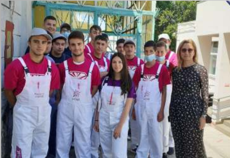
INSTALATOR – MONTEZ GIPS CARTONI!